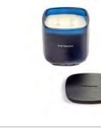
Fragrance Candle Blue 6PM Medium PB B6517105 10x10 - H11cm