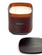
Fragrance Candle Brown 11PM Large PB B6517110 12x12 - H13cm