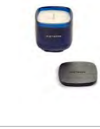
Fragrance Candle Blue 6PM Small PB B6517101 8x8 - H9cm