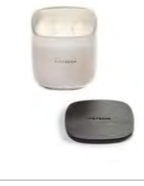
Fragrance Candle White 7AM Medium PB B6517104 10x10 - H11cm