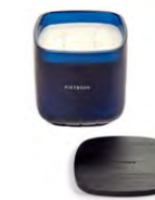
Fragrance Candle Blue 6PM Large PB B6517109 12x12 - H13cm