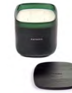
Fragrance Candle Green 10AM Large PB B6517111 12x12 - H13cm