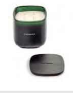
Fragrance Candle Green 10AM Medium PB B6517107 10x10 - H11cm