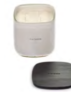
Fragrance Candle White 7AM Large PB B6517108 12x12 - H13cm