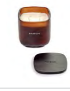
Fragrance Candle Brown 11PM Medium PB B6517106 10x10 - H11cm