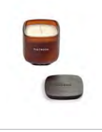
Fragrance Candle Brown 11PM Small PB B6517102 8x8 - H9cm