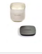
Fragrance Candle White 7AM Small PB B6517100 8x8 - H9cm