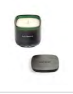
Fragrance Candle Green 10AM Small PB B6517103 8x8 - H9cm